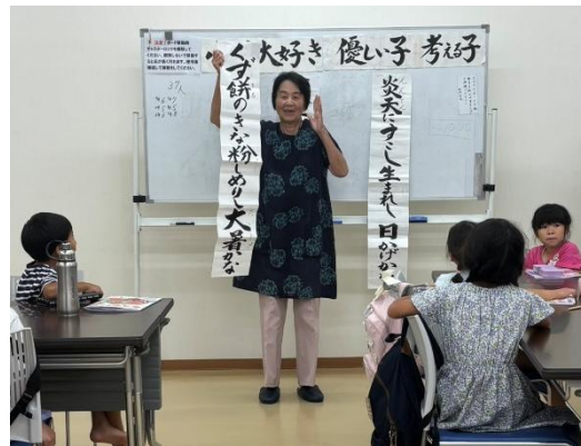
夏休み子ども塾の開催